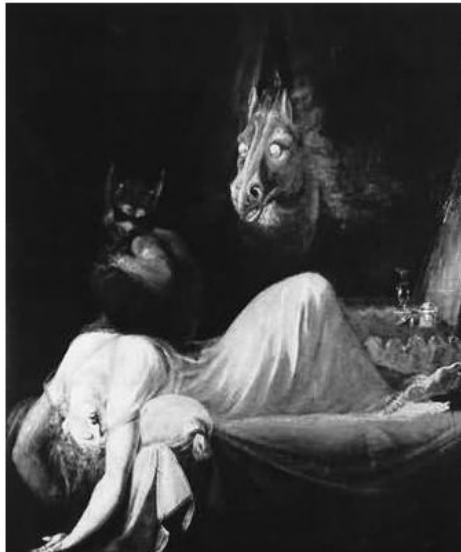
DE INCUBUS IN DE 1810-VERSIE

De nachtmerrie van Fuseli is aldus een klassiek geval van een "kunstwerk met ballen", maar daardoor heeft het wel een overdreven iconografie, waardoor de artistieke waarde van het werk belangrijker is dan de journalistieke. Behalve de aap of gnome op de borst zien we ook een spookachtig paardenhoofd om de hoek gluren. Dit paardenhoofd vertegenwoordigt uiteraard het woord "mare" in "Nightmare", maar de semantische link naar een paard is geheel op een misverstand gebaseerd. De woorden nightmare en nachtmerrie hebben niets met een paard te maken en vinden hun oorsprong in het Noordduitse Moar (mannelijk) Moare (vrouwelijk), Moart , Mahrt of Mare en mogelijk, maar dat is speculatief, is Mare weer overgenomen van de Mares van de Romeinen. In Oost Friesland wordt overigens van een Woariderske of Wäriderske gesproken en in district Wendish-Bucholz van een Murraue . Ook van de Murraue had je een mannelijke en een vrouwelijke vorm, net als de mannelijke incubus (opligger) en de vrouwelijke succubus (onderligger). De algemene term voor het wezen dat nachtmerries veroorzaakt is