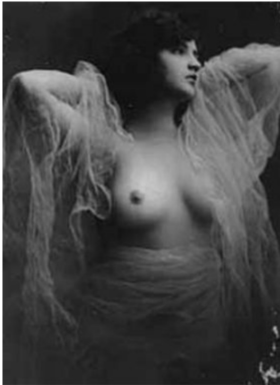
INCUBI EN SUCCUBI PROJECTEREN TELEPATISCH EROTISCHE DROMEN

Moderne verslagen van incubi en succubi nemen sterk toe sinds OBE (Out of Body Experience) een populair fenomeen begint te worden. Sinds de publicatie van Robert A Monroe's Journeys of of the Body in 1971 is de interesse in het