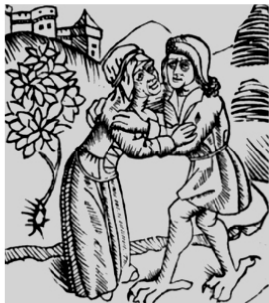
HEKS MET INCUBUS

In de Middeleeuwen en Renaissance waren de incubi en succubi een groot maatschappelijk probleem, althans dat werd er van gemaakt door mensen als bijvoorbeeld Paus Innocent VIII in zijn Summis Desiderantes Affectibus uit 1484: 'Veel mensen van beide geslachten, niet aan hun eigen verlossing denkend en afdwalend van het katholieke geloof, hebben zichzelf overgegeven aan duivels, incubi, succubi. Zulke duivels hinderen mannen in het verrichten van de seksuele daad en vrouwen in het ontvangen...' De banvloek die de katholieke opinieleiders over de seks met incubi en succubi hadden uitgesproken leidde regelmatig tot hysterische excessen en uiterst gewelddadige politieke acties. Een groep die zich verzette tegen de kerkelijke taboes waren de "heksen". Een term die hier voorzichtig moet worden gebruikt omdat er periodes waren waarin zonder uitzondering elke vrouw in een streek door de inquisiteurs tot heks werd gebombardeerd en vervolgd. Reginald Scot geeft in zijn boek The Discoverie of Witchcraft uit 1584 een aantal voorbeelden van de rol die incubi en succubi vervulden bij de seksuele bevrediging. Even voor de duidelijkheid; een incubus en een succubus zijn één en hetzelfde wezen dat zich respectievelijk aan mannen als een succubus of