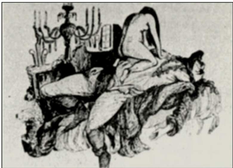
SUCCUBUS uit: Histoire curieuse et pittoresque des sorciers, augmentée par M. Fornari uit 1854

In de regel hanteren mensen die nachtelijk bezoek van een incubus of succubus krijgen sterke of zelfs fundamentalistisch taboes op masturbatie en lustgevoelens. Sla je de oude bronnen er op na, dan worden met name nonnen in kloosters zwaar getroffen. In het Israël van vandaag hebben psychiaters hun handen vol aan de psychische problemen die bij jonge orthodoxe mannen ontstaan door het verbod op masturbatie. Bij sterk onderdrukte seksuele drift dienen de fantasieën zich vaak vanzelf en in een steeds intensere vorm aan. Bij mannen die het langere tijd zonder een vrouw moeten stellen hoopt zich, zoals we eerder lazen, volgens de taoïstische visie een steeds grotere hoeveelheid pai-ching op en die troep moet er gewoon uit om de qi-stroom te normaliseren. Los van alle Oosterse wijsheid herkent elke normale, gezonde man dit verschijnsel en is het gewoon een autoregulerend mechanisme in de hersenen dat ervoor zorgt dat als je ballen een beetje zwaar worden, je fantasie