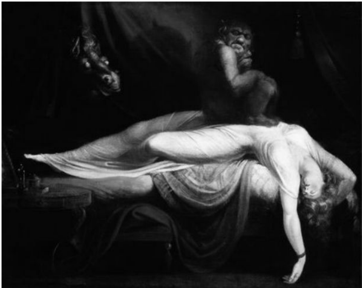
DE INCUBUS OF NIGHTMARE VAN HENRY FUSELI IN DE 1781-VERSIE

Johann Heinrich Füssli, als zoon van een portretschilder en verzamelaar van 16de en 17de eeuwse kunst. Zijn vader brengt hem in contact met de neoclassicistische ideeën van Winckelmann en Anton Raphael Mengs. Hij leest Milton, Dante, das Nibelungenlied, Rabelais en Shakespeare, is de boezemvriend van William Blake en kent de schrijfster van Frankenstein, Mary Woolstonecraft persoonlijk. Toen hij in zijn studentenjaren een fout politiek pamflet publiceerde samen met zijn vriend Johann Lavater, achtten de twee het verstandig om Zwitserland te verlaten en via een jaartje Berlijn belanden ze uiteindelijk in Engeland. Aldaar verruult Fuseli zijn theologiestudie en dichtersambities definitief voor de schilderkunst. Zijn werk bestaat veelal uit spookachtige ruimtes met oplichtende drama's op de voorgrond vol heftige ontspoorde emoties. Leitmotieven zijn Germaanse en Keltische mythen, Shakespeare, een "gothic-erotiek" van dominante, slapende of flauwvallende halfontklede vrouwen en 'the moment of terror'. Bij dit alles vind je steeds weer een grove, plastische schildertoets terug die herinnert aan de acht jaar die Fuseli in Rome doorbracht met tekenstudies naar het plafond van de Sixtijnse Kapel, die zijn werken onmiddellijk herkenbaar maakt. In de periode 1780-1790 is Fuseli erg gecharmeerd van meer occulte thema's met een accent zoals we dat eerder tegenkomen bij Dürer en Baldung Grien.